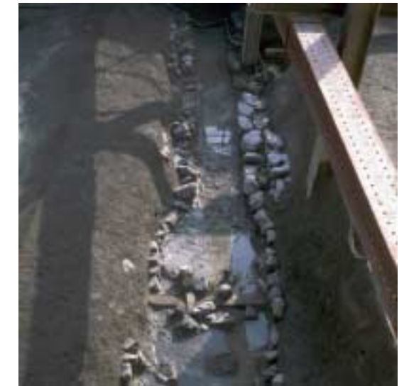
写真7 江戸後期の石組溝(東調査区)

江戸時代の地図をみると、調査地周辺は全時代に渡って大坂城代の屋敷地として描かれています。今回の調査では江戸時代前期(17世紀)に遡る遺構は井戸だけで希薄でしたが、18世紀の後半から幕末にかけては石組溝(写真7)・井戸・ゴミ穴などたくさんの遺構や遺物が見つかりました。18世紀の終わりから19世紀のはじめには大きな土地利用の改変が行われたらしく、調査地の西側は屋敷地として利用され続けますが、東側は大規模な土取りが行われ、その上では畑がつけられていたようです。