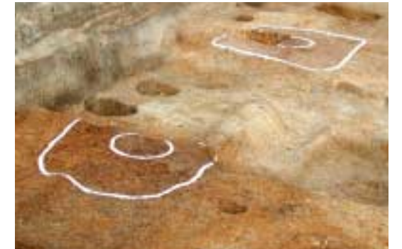
写真4 古代の柱穴(東調査区北西部)

東調査区では大規模な造成工事の跡が見つかりました。半径が5~6mの穴が東西・南北方向連なる形で、L字状に上町台地の洪積層が3m近く掘り窪められています。壁はまっすぐに削り落とされ、底は平坦になっています。当初は堀の可能性を考えましたが、雑壇状の造成の一部なのかもしれません。この大規模な落ちは豊臣後期に一気に埋め戻されています。西側調査区では井戸や土塙、柱穴など見つかり、屋敷地が広がっていたことがわかりました。井戸の中からは金箔押瓦や志野焼・唐津焼・青花といった陶磁器類のほか、箸や曲物などの木製品が出土しました。