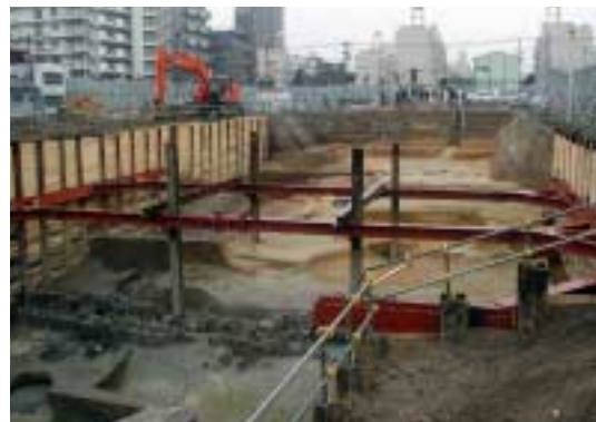
写真1 東側に下がる地形(東調査区)

大阪市教育委員会と(財)大阪市文化財協会は、昨年11月から、集合住宅の建替えが予定された東西2ヶ所で調査区を設定し、発掘調査を行ってきました。調査地は、地形的には上町台地の東側斜面に当り、西から東に向かって徐々に土地が低くなっています(写真1)。また、歴史的景観からみると、古代には難波宮内裏域の東方約100mに位置し、宮域と京域の東側境界が推定される一方、豊臣期には多くの大名が屋敷を構えた大坂城三の丸の中に含まれていたと考えられます。今回の発掘調査では、難波宮や豊臣期大坂城に係わる遺構や遺物が見つかったほか、古墳時代から江戸時代にわたる人々の土地利用の過程を把握することができました。