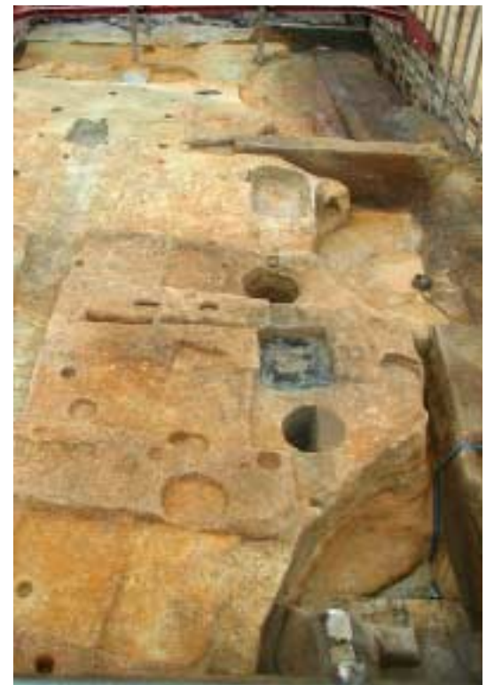
写真6 豊臣期の落ち(東調査区南西部)