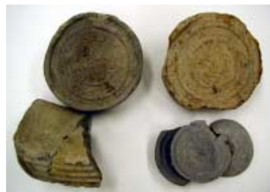
写真3 飛鳥時代の須恵器と後期難波宮の瓦