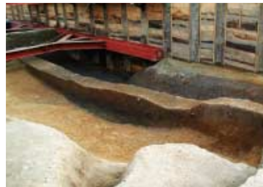
写真2 古代の谷の肩(東調査区南部)