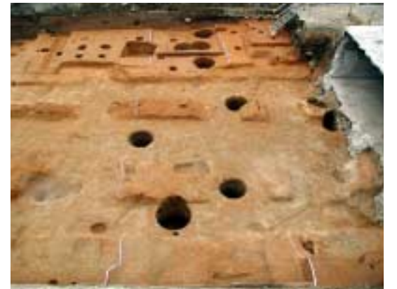
写真5 後期難波宮区画溝(西調査区) 上は全景、下は断面